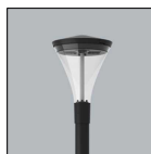
OPRAWA Z6: PAREO PRO LED 2800 STREET-M26 E IP66 04 740 (14.0 W) lub równoważne