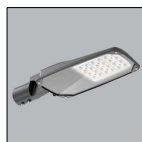
OPRAWA Z3: STREETPARK MINI V2 LED PREMIUM 9200 PARKING E IP66 43 740 (51.0 W) lub równoważne