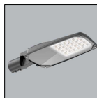
OPRAWA Z4: STREETPARK MINI V2 LED PREMIUM 8000 ASYMMETRIC E IP66 43 740 (43.0 W) lub równoważne