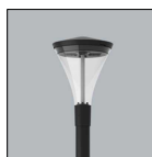
OPRAWA Z5: PAREO PRO LED 2800 AREA E IP66 04 740 (14.0 W) lub równoważne