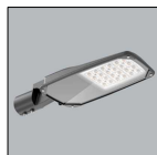
OPRAWA Z1: STREETPARK MINI V2 LED PREMIUM 8000 ROAD E IP66 43 740 (43.0 W) lub równoważne

Oprawy oświetleniowe ze źródłem światła LED 4000K, IP minimum IP66. Oprawy montowane na stalowych słupach oświetleniowych. Słupy stożkowe o przekroju okrągłym, o wysokości H=3 m oraz H=8 m, na podstawie tłoczzonej 280x280 mm.