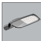
OPRAWA Z2: STREETPARK MINI V2 LED PREMIUM 8000 ROAD E IP66 43 740 (51.0 W) lub równoważne